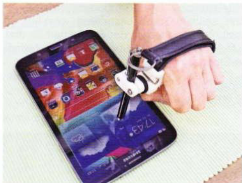
Ein äußerst praktisches Hilfsmittel von Mehal für alle Menschen mit Greifschwierigkeiten.

Die Hilfsadaption zeichnet sich durch folgende Merkmale aus: Durch den angebrachten Riemen ist diese Hilfsadaption handgrößenunabhängig. Die Aufnahme kann so angebracht